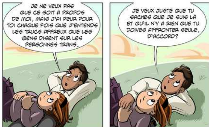
BD de Sophie Labelle Assignée Garçon

toute : chaque jour il y aura besoin de poser des actes, d'incarner certaines attitudes pour lutter contre les oppressions (ici la transphobie). Ce ne sont pas non plus des actions que l'on fait pour gagner des « bons points de militance » ni pour s'alléger de la culpabilité d'avoir le privilège d'être une personne cis et/ou dyadique.