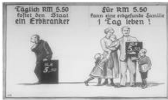
Propagande nazi contre les personnes handicapées qui coûtent chers à l'état.